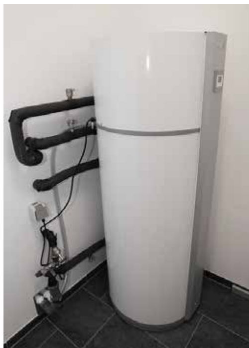
METRO Microbooster i en af lejlighederne.