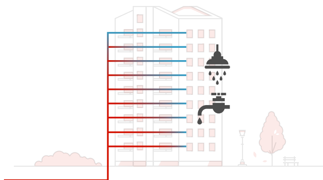
Lejlighedskompleks uden METRO Microbooster

En METRO Microbooster kan hjælpe med at opnå god brugsvandskomfort der, hvor varmesystemet kan have svært ved at følge med.